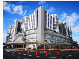
至 さいたま市立病院